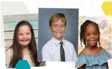
Fall Fundraiser & Yearbook Images

Pictures will be taken for the school yearbook and for school ID cards. Students must wear their dress uniform: Khaki pants/skirt, blue polo with the school logo, and of course...a big smile! We are strongly encouraging online ordering, it's simple and you need to order before picture day! To place your online order go to: https://vando.imagequix.com/g1000864569 If you prefer not to order online, next week we will send home with your child the envelope order form.