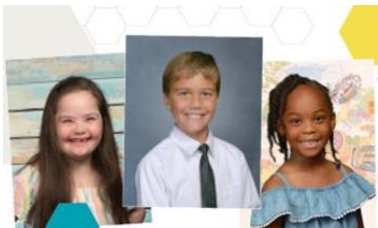
Fall Fundraiser & Yearbook Images

Se tomarán fotos para el anuario escolar y para las tarjetas de identificación de la escuela. Los estudiantes deben usar su uniforme de: pantalón/falda color kaki y polo con el logo de la escuela, y por supuesto... ¡una gran sonrisa! Recomendamos encarecidamente los pedidos en línea, es simple y debe realizar el pedido antes del día de la foto! Para realizar su pedido en línea, vaya a: https://vando.imagequix.com/g1000864569 Si prefiere no hacer un pedido en línea, la próxima semana le enviaremos con su hijo(a) el formulario/sobre de pedido.