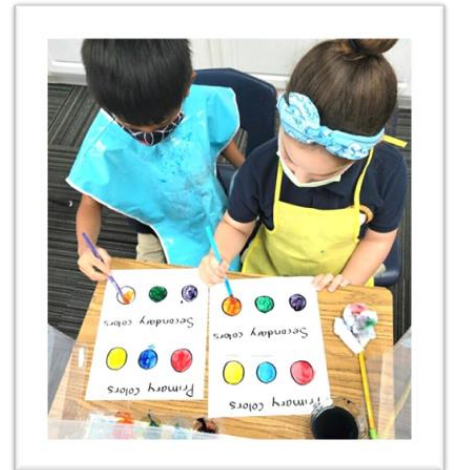
Mrs. Santana's first grade students learn how to mix primary colors to make secondary colors.