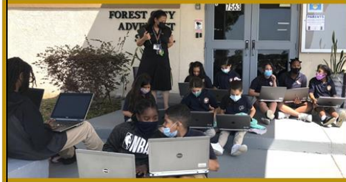
Students sit by the front entrance of the school with their computers.