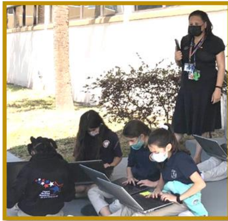
Los estudiantes se sientan en la entrada principal de la escuela con sus computadoras.